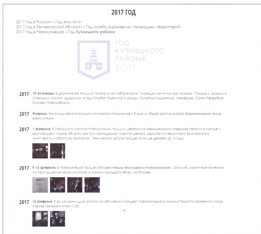
Рис. 5. Пример прикрепления фотографий на страницах блока «Хроника за 400 лет»

рованному учету и систематизации фотодокументов по локальной истории. Списки дат (хроники) автоматически выстраиваются в хронологическом порядке. Не нужен справочный аппарат, как в печатных календарях, отпадает необходимость в составлении вспомога-